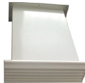
Z tworzywa typu ZENA